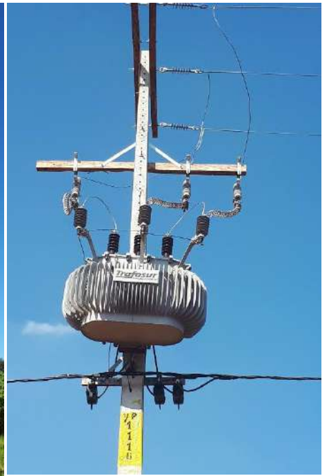
Construcción de Redes de MT, BT y Montaje de PD. Licitación Pública Nacional ANDE N° 1326/2017, Asentamiento Ypane, Dpto. Central – Lote 5 – BONOS II