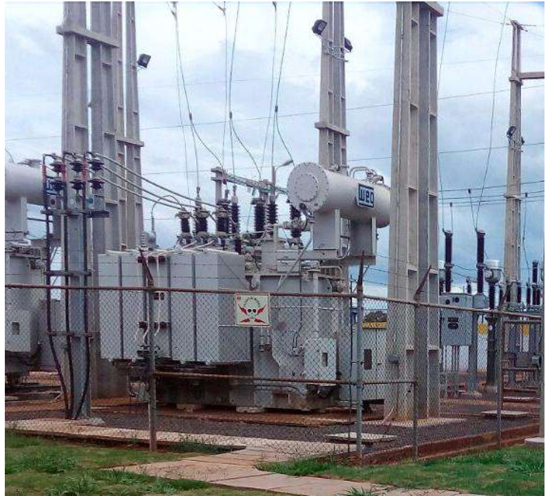
Ampliación de la Subestación PEDRO JUAN CABALLERO Licitación Pública Internacional ANDE N° 914/2013 - Lote 2 - BONOS I