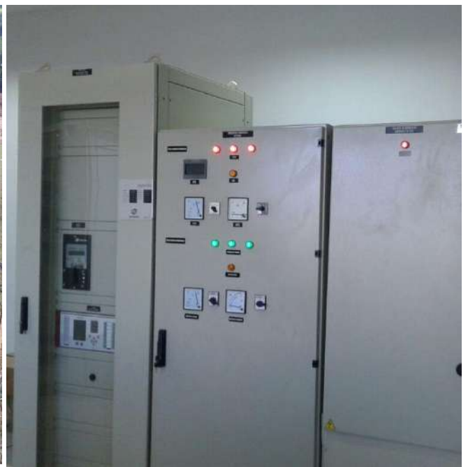
Construcción de la Subestación CURUGUATY 220/23 kV Licitación Pública Nacional ANDE N° 851/2013 - Lote 5 - BONOS I