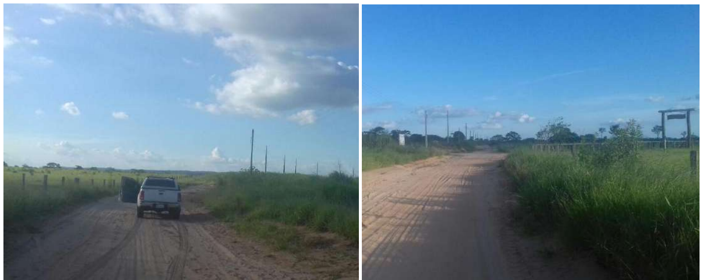
Adecuación de Línea de Media Tensión y Baja Tensión, y Montaje de Puesto de Distribución para Asentamientos de los Distritos de Curuguaty, Ybypyta, Villa Ygatymi, Corpus Cristi (Lote 1). Licitación Pública Nacional ANDE N° 1172/2015