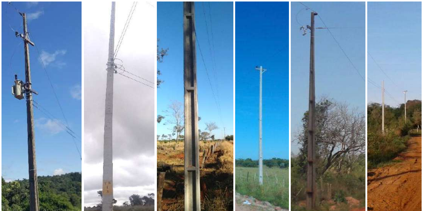
Ejecución de trabajos de normalización de 376 km de líneas de autoayuda en MT y BT, en el Dpto. de Cordillera - Licitación Pública Nacional ANDE N° 1170/2015 – Lotes 1, 2, 3, 4, 5 v 6 - BONOS II