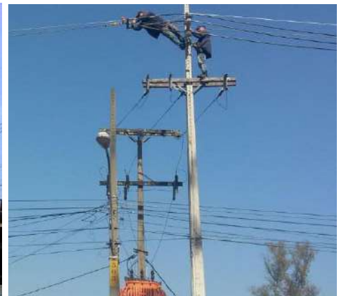
Adecuación de red de MT y BT a Protegida y Preensamblada en los Alimentadores de los Centros de Distribución San Lorenzo, La Victoria y Capiatá, en el Dpto. Central Licitación Pública Nacional ANDE N° 1036/2014 – Lotes 1 y 4 - BONOS I