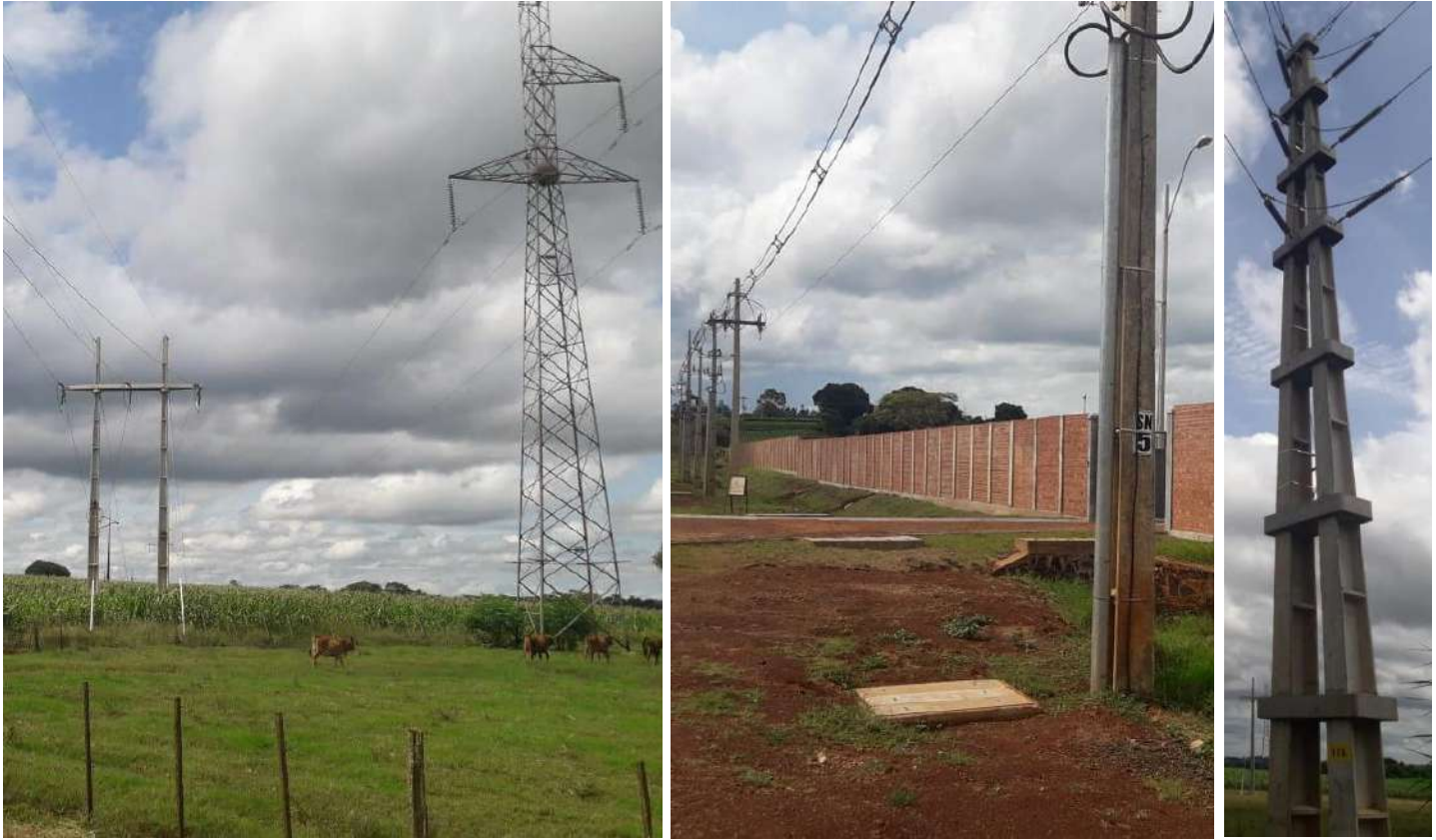
Construcción de Obras de Distribución con provisión total de materiales, Distrito de Fram, Dpto. de Itapúa - Licitación Pública Nacional ANDE N° 1200/2016 – Lotes 2 y 3 – BONOS II