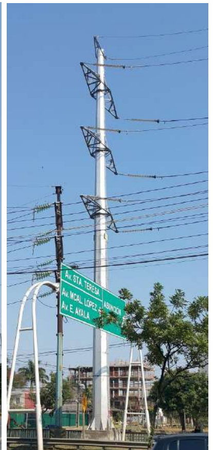
Construcción de la Línea de Transmisión de 220 kV entre las Subestaciones Puerto Botánico y Barrio Molino - Licitación Pública Nacional ANDE N° 1090/2014 - Lote 2 - BONOS II