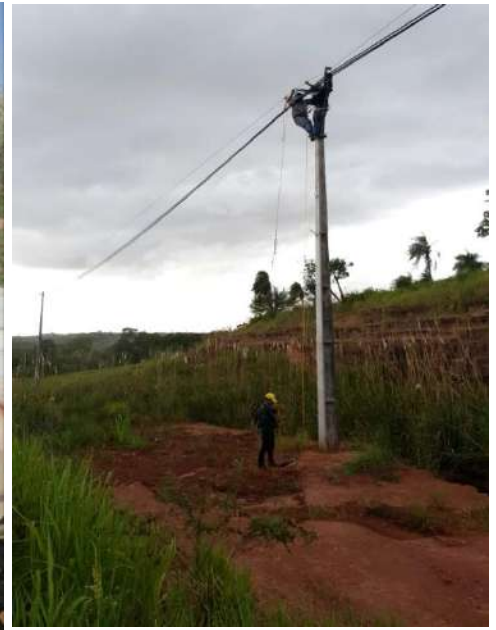
Construcción de Nuevos Alimentadores de Media Tensión emergentes del Centro de Distribución Curuguay II, en el Distrito de Curuguay, Departamento de Canindeyú- Licitación Pública Nacional ANDE N° 1221/2016 – BONOS I