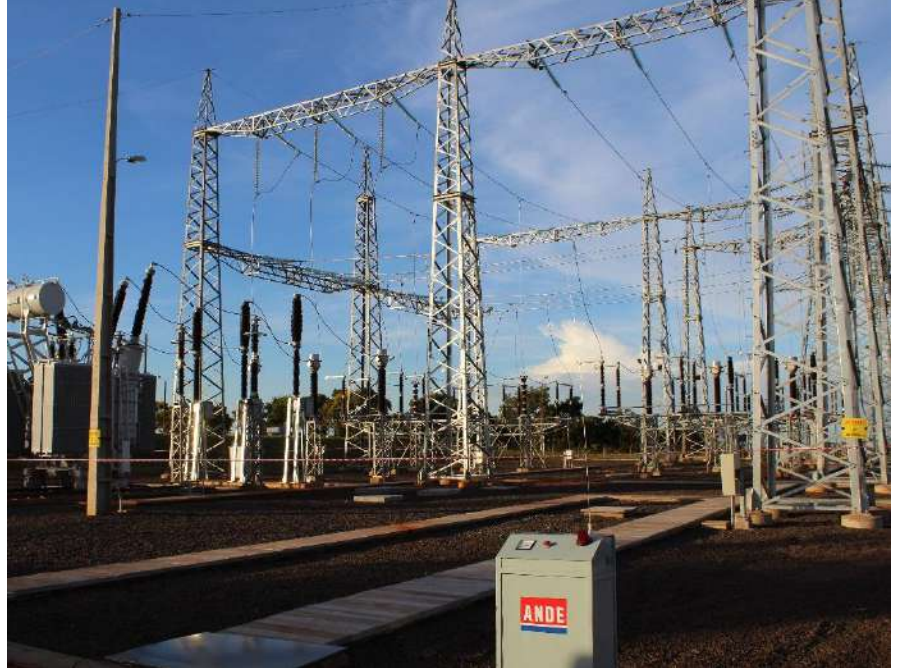
Construcción de la Subestación CERRO CORÁ 220/66/23 kV Licitación Pública Nacional ANDE N° 851/2013 - Lote 6 - BONOS I