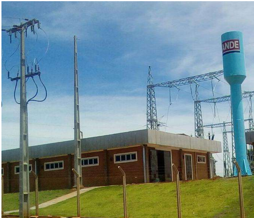
Construcción de la Subestación CAPITÁN BADO 220/23 KV - Licitación Pública Nacional ANDE N° 851/2013 - Lote 4 - BONOS I