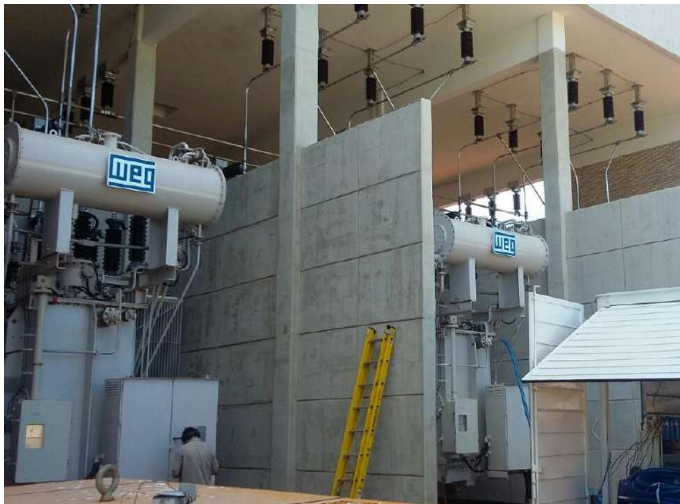
Construcción de la LT 66 kV subterránea SAN LORENZO - FDO. DE LA MORA - Licitación Pública Nacional ANDE N° 852/2013 - Lote 2 - BONOS I