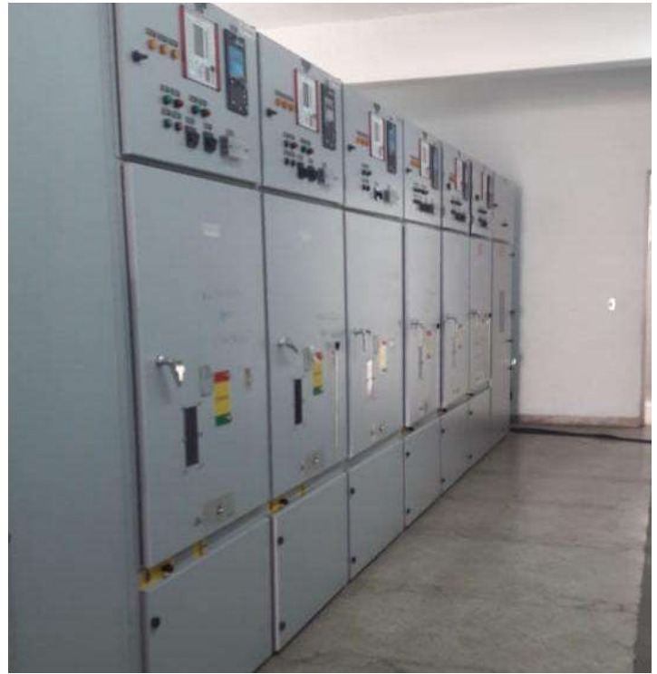
Ampliación de la Subestación GENERAL DIAZ Licitación Pública Internacional ANDE N° 914/2013 - Lote 7 - BONOS I