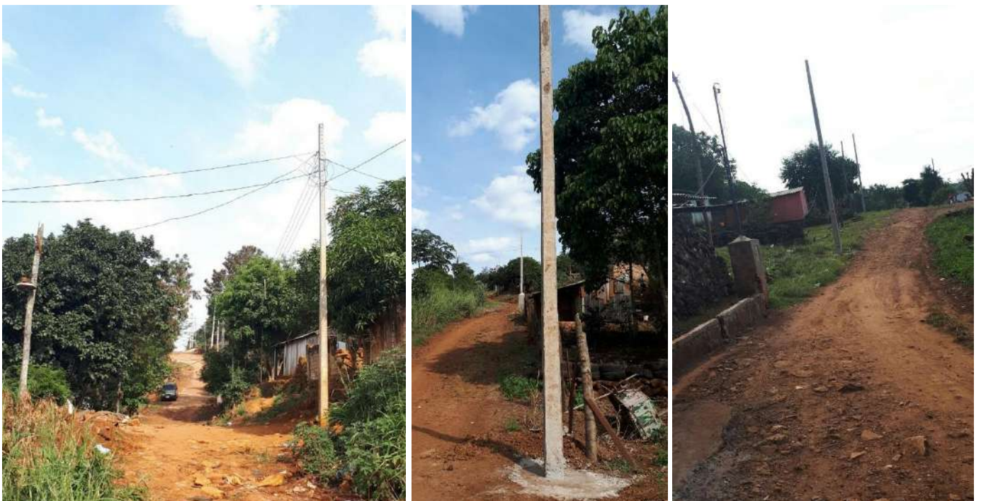
Construcción de Redes de MT, BT y Montaje de PD. Licitación por Concurso de Ofertas N° 956/2017, Asentamiento de Mcal. López-km4, del Distrito de Ciudad del Este – Lote 3 – BONOS II