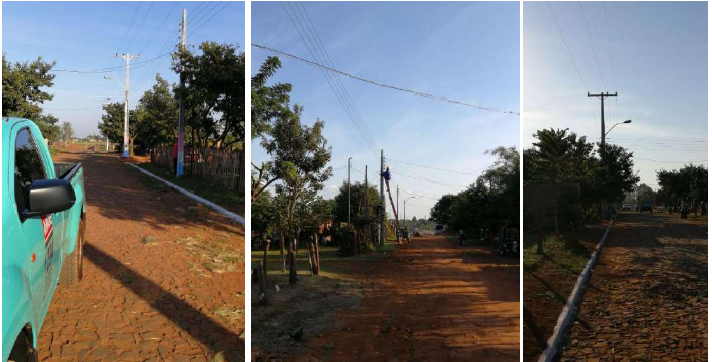
Construcción de Redes de MT, BT y Montaje de PD. Licitación por Concurso de Ofertas N° 956/2017, Distritos de Minga Guazú y Hernandarias, Dpto. Alto Paraná – Lotes 1 y 2 – BONOS II