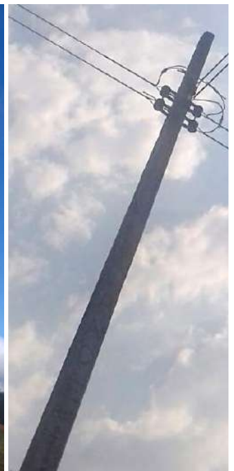
Ejecución de Trabajos de Normalización de Líneas de Autoayuda en MT y BT Licitación Pública Nacional ANDE N° 992/2014 - Lotes 1, 2, 3, 4 y 5 - BONOS I