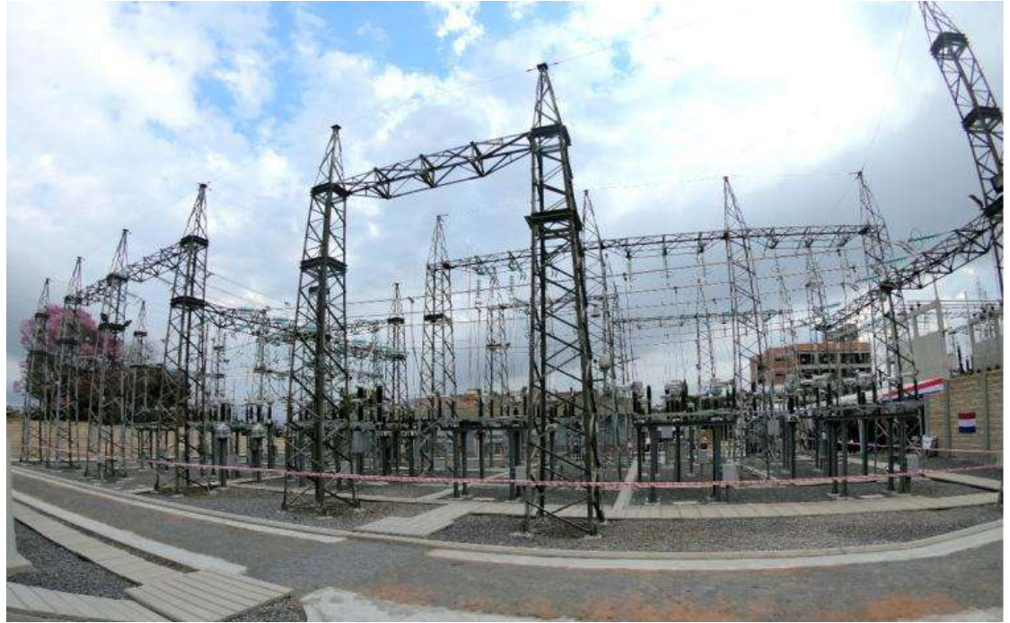
Ampliación de la Subestación LAMBARÉ Licitación Pública Internacional ANDE N° 914/2013 - Lote 5 - BONOS I