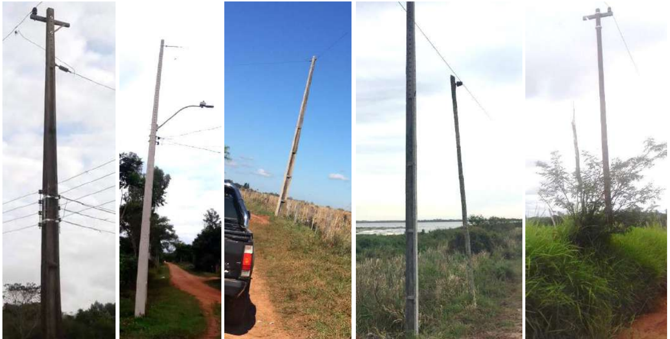
Ejecución de trabajos de normalización de líneas de autoayuda en MT y BT, en los Dptos. de Guairá, Misiones y Paraguarí – Licitación Pública Nacional ANDE N° 1169/2015 - Lotes 1, 2, 3, 4 v 5 - BONOS II