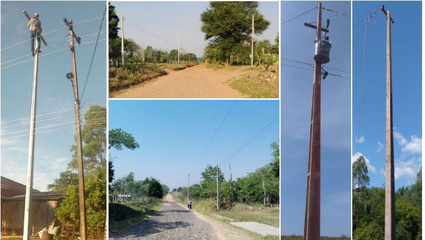
Ejecución de Trabajos de Normalización de Líneas de Autoayuda en MT y BT Canindeyú y San Pedro - Licitación Pública Nacional ANDE N° 1016/2014 - Lotes 1, 2, 3 - BONOS I