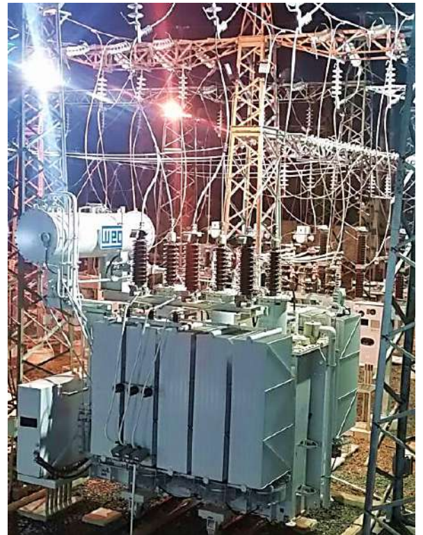
Ampliación de la Subestación HERNANDARIAS Licitación Pública Internacional ANDE N° 914/2013 - Lote 4 - BONOS I