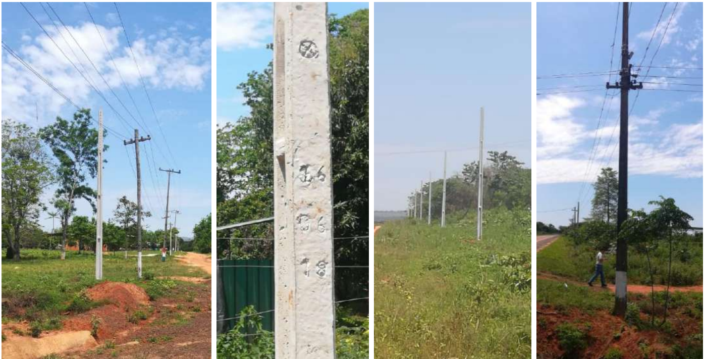
Construcción de Redes de MT, BT y Montaje de PD. Licitación Pública Nacional ANDE N° 1321/2017, Asent. Tava Guaraní, Distrito de Santa Rosa del Aguaray. Dpto. de San Pedro. Lote 2 – Bonos II