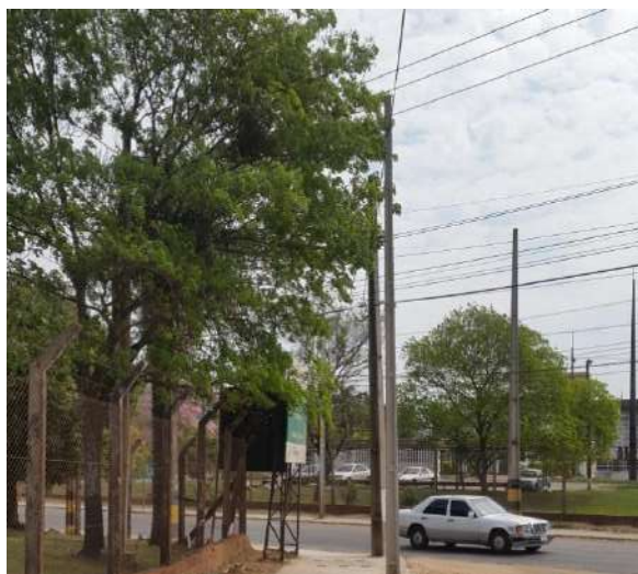
Construcción de Nuevas Líneas de MT PBO 02-05, para alimentación de viviendas sociales en el RC4, en las Ciudades de Asunción y Mariano Roque Alonso, Distrito Capital y Dpto. Central - Licitación Pública Nacional ANDE N° 1168/2015 – Bonos II