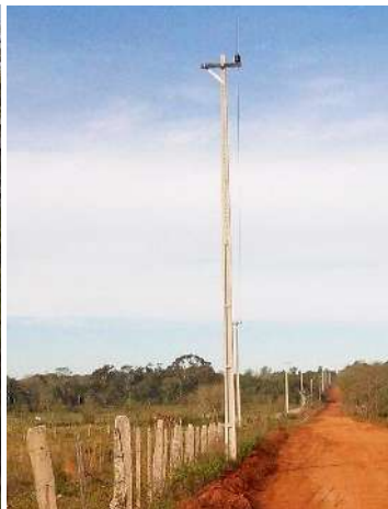
Ejecución de Trabajos de Normalización de Líneas de Autoayuda de BT y MT Licitación Pública Nacional ANDE N° 990/2014 - Lotes 4, 5, 6, 7 y 8 - BONOS I