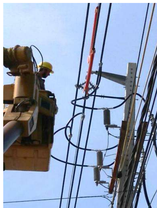
Construcción de Nuevos Alimentadores de Media Tensión emergentes del Futuro Centro de Distribución Fernando de la Mora, Distritos de Fdo. de la Mora y Asunción- Licitación Pública Nacional ANDE N° 1222/2016 – BONOS I