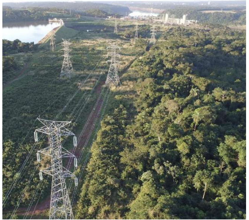
Construcción de la línea de transmisión 2 x 220 kV Acaray - Pte. Franco - Licitación Pública Nacional ANDE N° 1088/2014 - Lote 2 - BONOS II