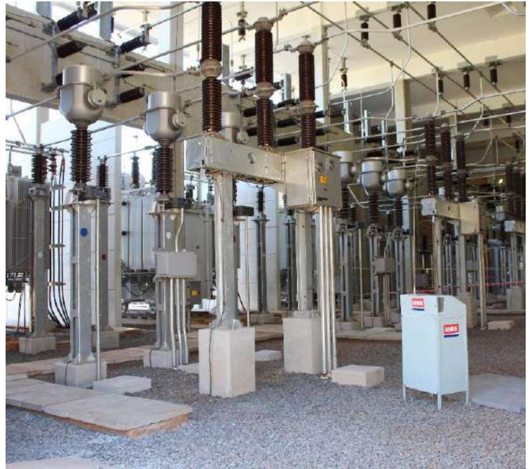
Construcción de la Subestación FERNANDO DE LA MORA y Ampliación de la Subestación SAN LORENZO - Licitación Pública Nacional ANDE N° 852/2013 - Lote 1 - BONOS I