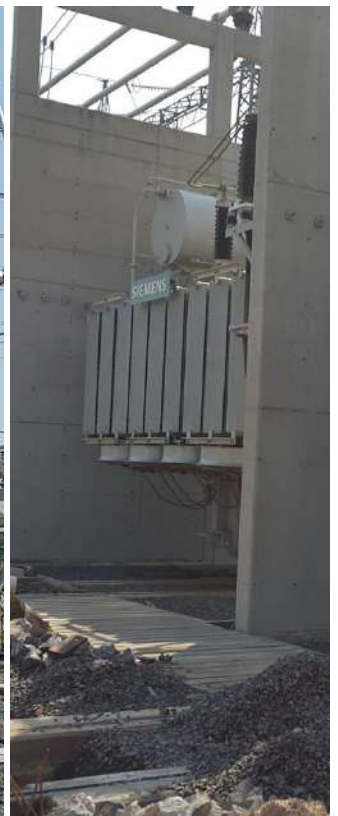
Ampliación de la Subestación PUERTO BOTÁNICO Licitación Pública Internacional ANDE N° 914/2013 - Lote 6 - BONOS I