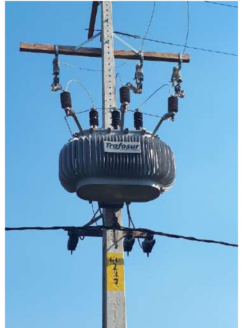
Construcción de Redes de MT, BT y Montaje de PD. Licitación Pública Nacional ANDE N° 1326/2017, Asentamiento San Rafael, Dpto. Central – Lote 4 – BONOS II