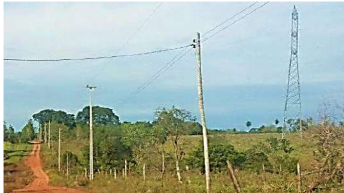
Ejecución de Trabajos de Normalización de Líneas de Autoayuda de BT y MT Licitación Pública Nacional ANDE N° 991/2014 - Lotes 3 y 6 - BONOS I