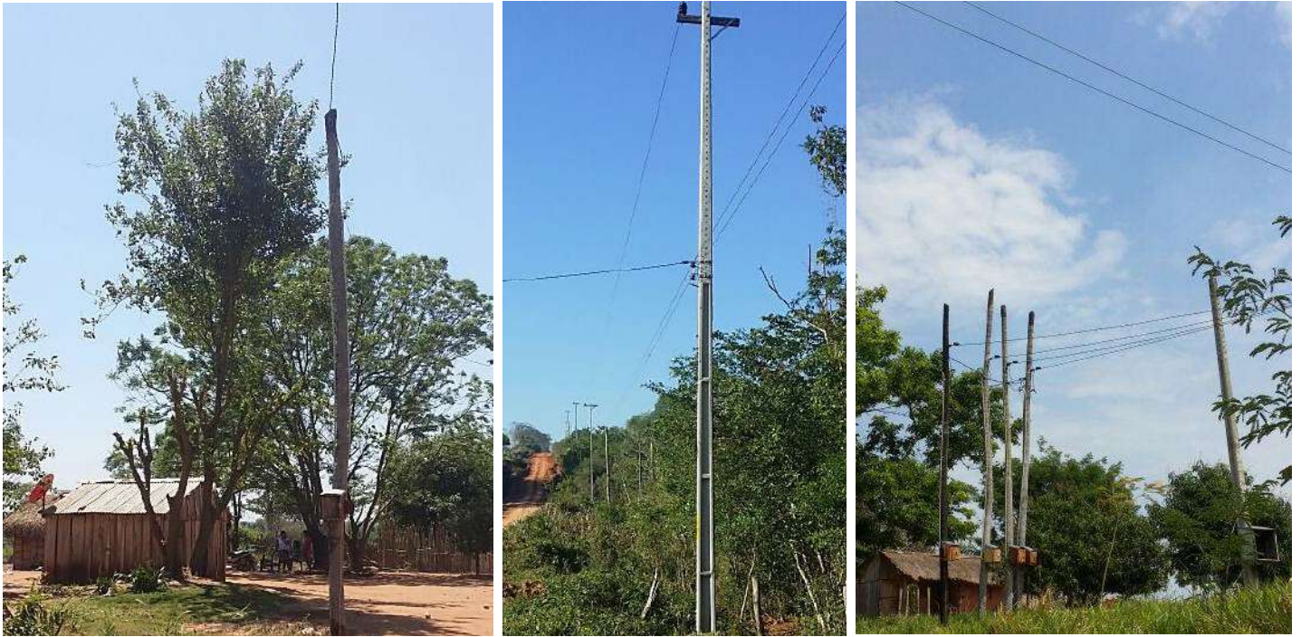
Ejecución de Trabajos de Normalización de Líneas de Autoayuda en MT y BT Canindeyú - Licitación Pública Nacional ANDE N° 1008/2014 - BONOS I