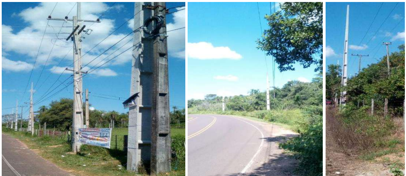
Construcción e interconexión de la Subestación Altos en 220 KV. Construcción de Obras de Distribución, incluyendo el suministro de materiales. Licitación Pública Nacional ANDE N° 1203/2016 - Lote 2 – BONOS II