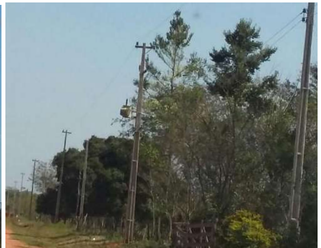
Ejecución de Trabajos de Normalización de Líneas de Autoayuda de BT y MT Licitación Pública Nacional ANDE N° 990/2014 - Lotes 1, 2 y 3 - BONOS I