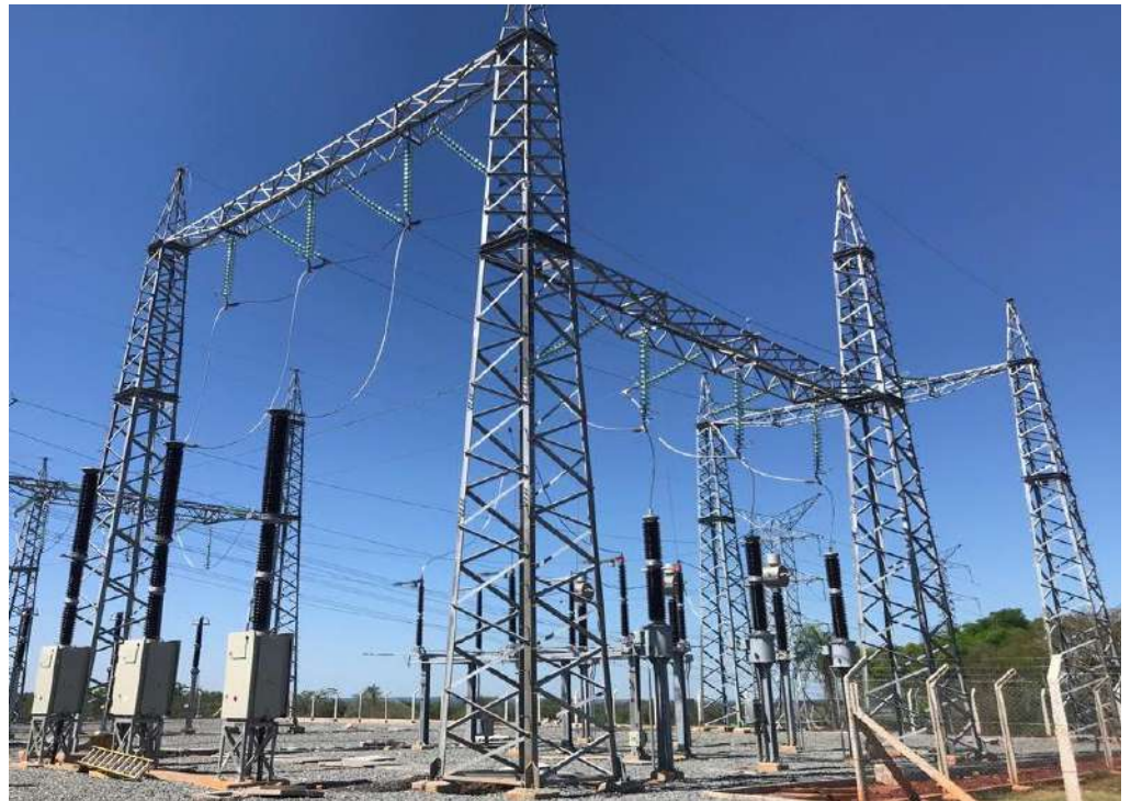
Construcción e Interconexión de la Subestación Altos en 220 kV, Licitación Pública Nacional ANDE N° 1203/2016 - Lote 1 - BONOS II