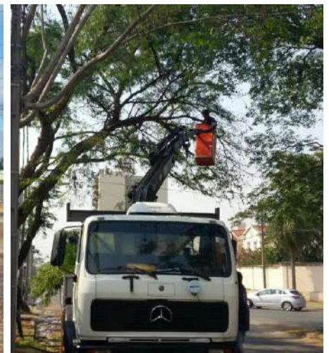
Adecuación de Red de MT y BT a Protegida y Preensamblada en Distritos de Asunción y Dpto. Central- Licitación Pública Nacional ANDE N° 1094/2015 – Lotes 1, 2 y 4 - BONOS I