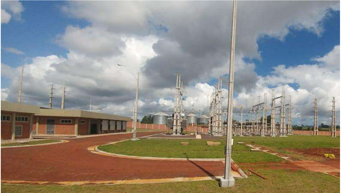
Construcción e Interconexión de la Subestación Fram 66 kV - Licitación Pública Nacional ANDE N° 1200/2016 - Lote 1 - BONOS II