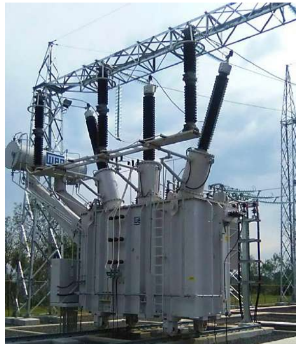
Ampliación de la Subestación SAN ESTANISLAO Licitación Pública Internacional ANDE N° 914/2013 - Lote 3 - BONOS I