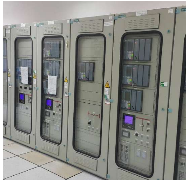
Construcción e Interconexión de la Subestación Villa Aurelia en 220 kV - Licitación Pública Nacional ANDE N° 1089/2014 - Lote 1 - BONOS II