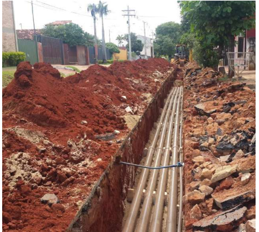
Construcción de LT Subterránea 66 kV - Refuerzo del Sistema Metropolitano – San Lorenzo - Fernando de la Mora, Licitación Pública Nacional ANDE N° 1230/2016 - Lote 1 - BONOS I