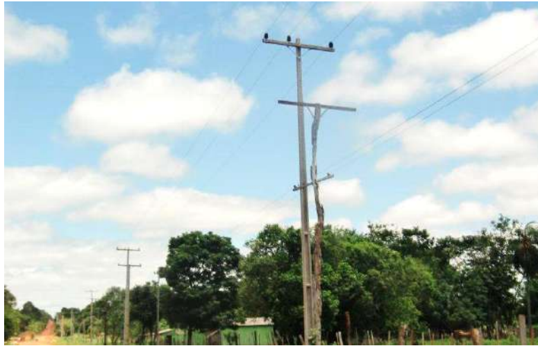
Ejecución de Trabajos de Normalización de Líneas de Autoayuda en MT y BT Canindeyú, Maracaná - Licitación Pública Nacional ANDE N° 969/2014 - BONOS I