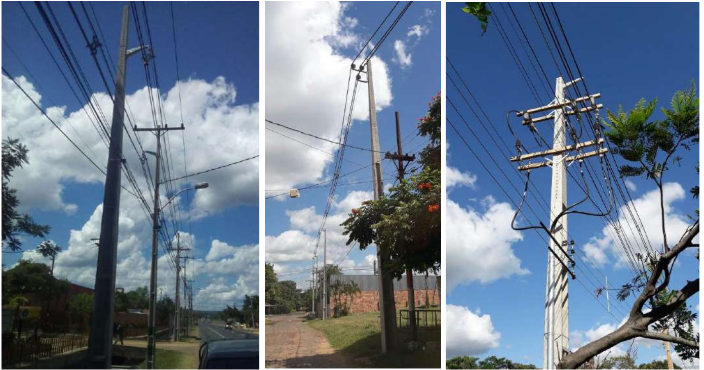
Construcción de nuevo alimentador de MT ITG 08 desde el Centro de Distribución Itauguá. Licitación Pública Nacional ANDE N° 1312/2017 – BONOS II